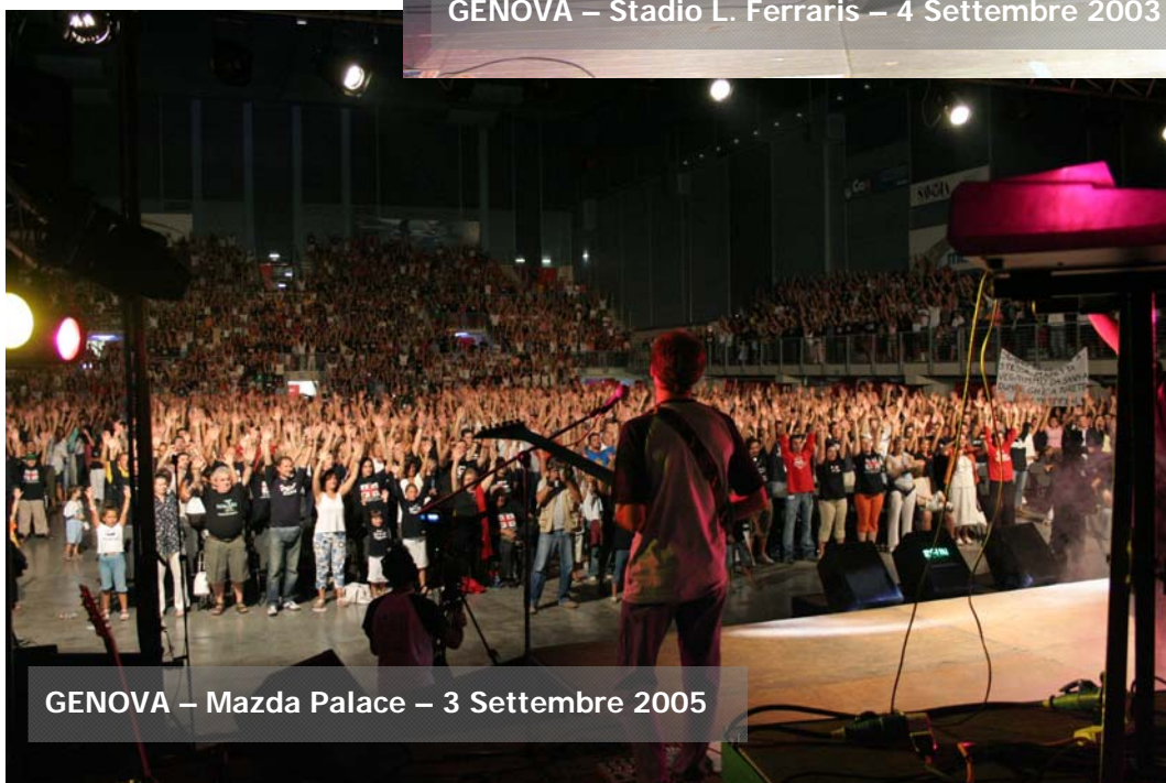
GENOVA – Mazda Palace – 3 Settembre 2005