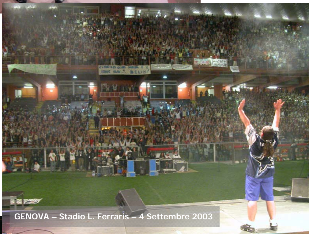
GENOVA – Stadio L. Ferraris – 4 Settembre 2003