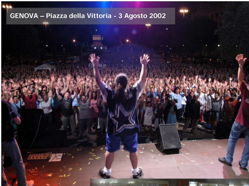
GENOVA – Piazza della Vittoria - 3 Agosto 2002