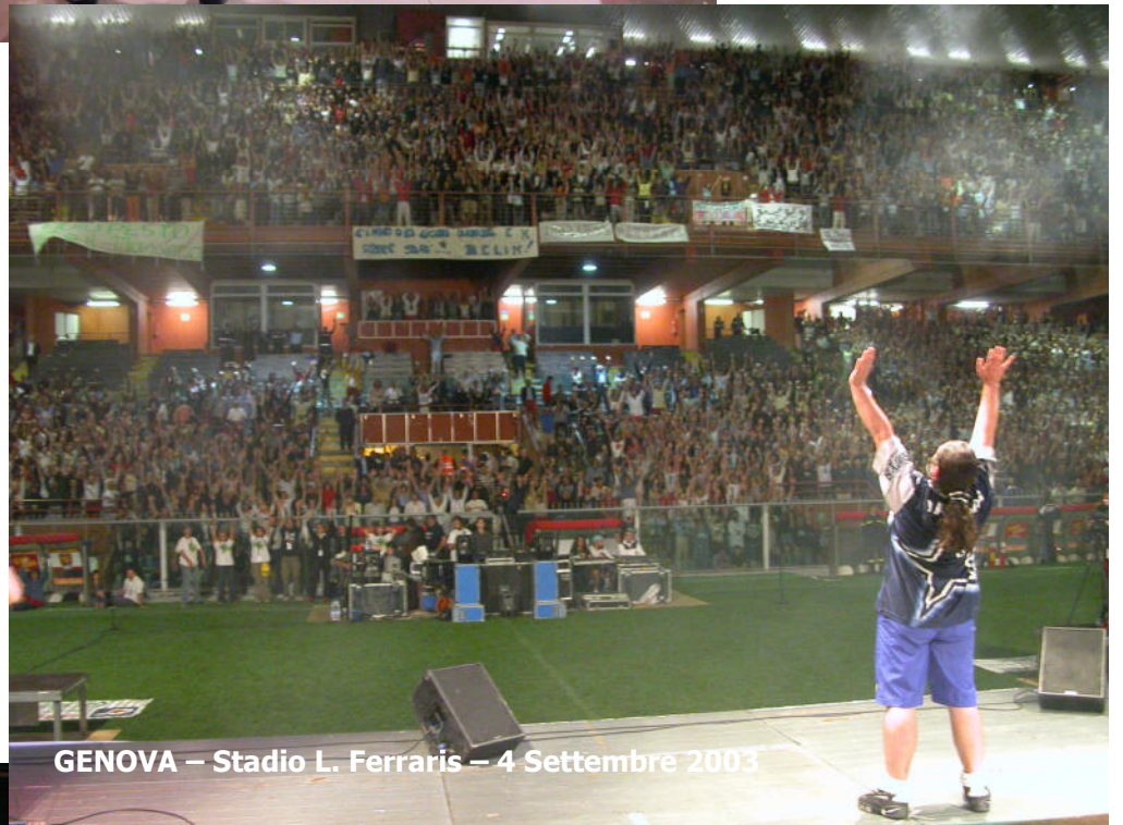
GENOVA – Stadio L. Ferraris – 4 Settembre 2003