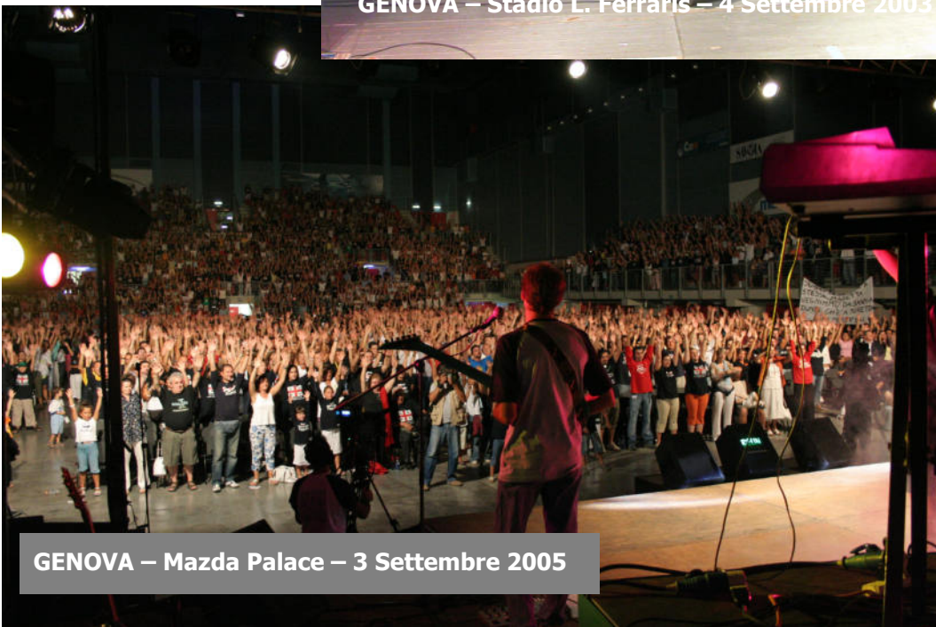
GENOVA – Mazda Palace – 3 Settembre 2005