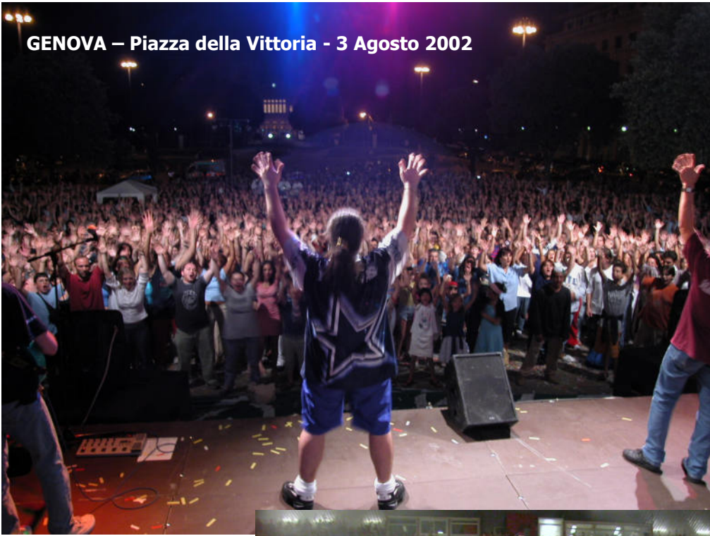
GENOVA – Piazza della Vittoria - 3 Agosto 2002