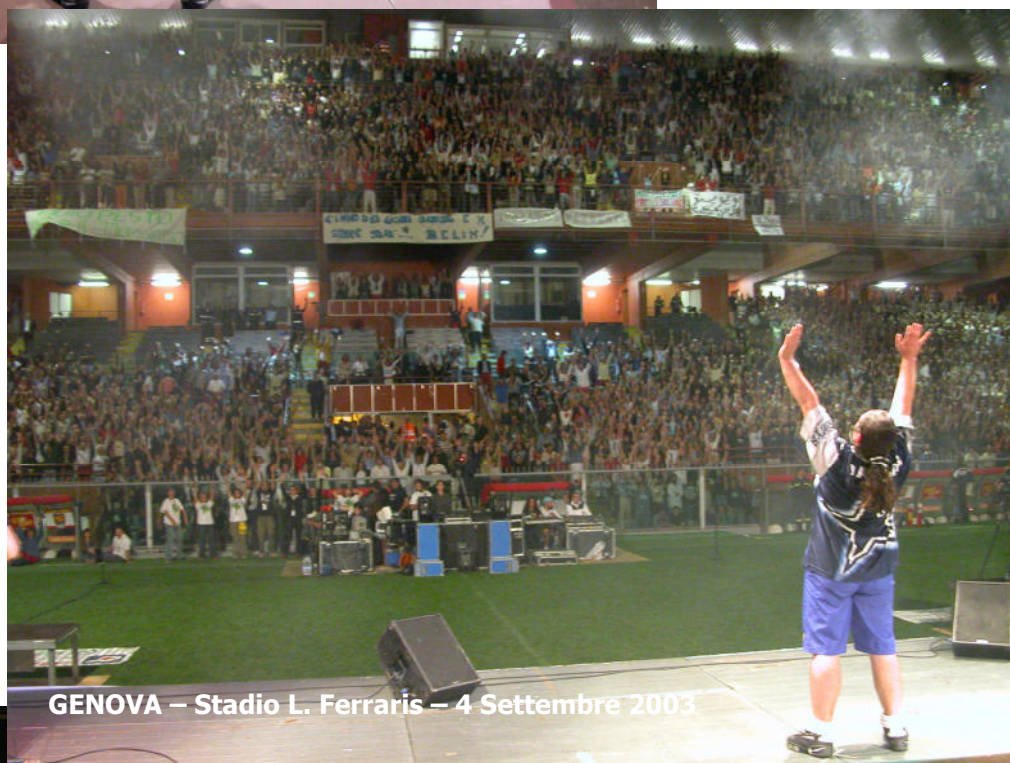
GENOVA – Stadio L. Ferraris – 4 Settembre 2003