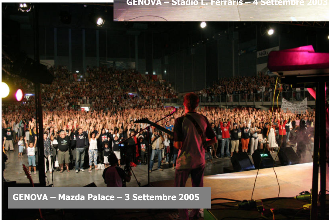
GENOVA – Mazda Palace – 3 Settembre 2005