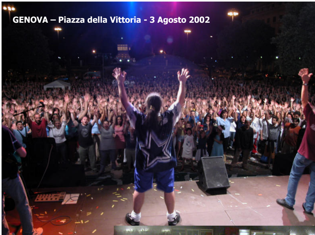
GENOVA – Piazza della Vittoria - 3 Agosto 2002