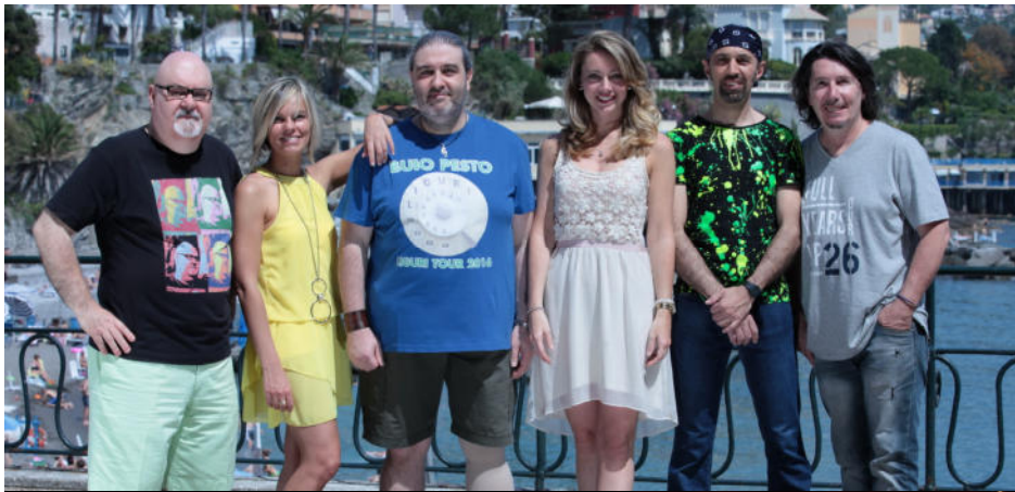
GENOVA – Piazza De Ferrari - 10 Settembre 2011

I Buio Pesto sono la più grande e divertente band dialettale ligure degli ultimi 25 anni. Dal 1995 ad oggi hanno venduto 190.000 dischi (Doppio Disco di Platino), hanno eseguito quasi 1.000 concerti, per un pubblico di oltre 1.400.000 spettatori e raccogliendo 300.000 euro per beneficenza.