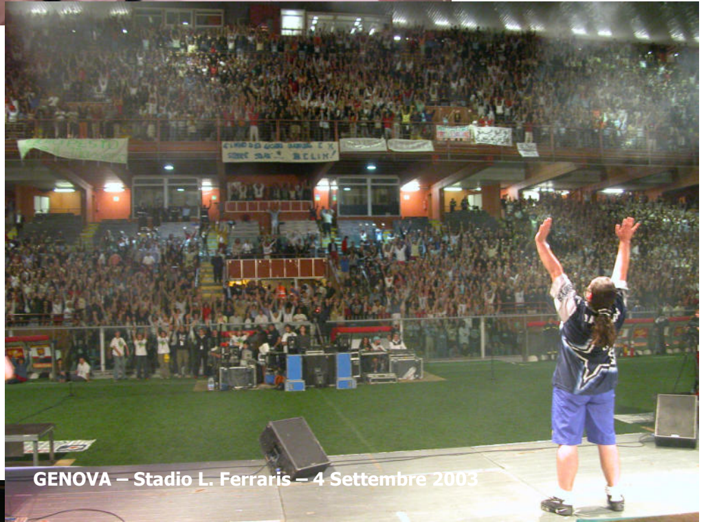
GENOVA – Stadio L. Ferraris – 4 Settembre 2003