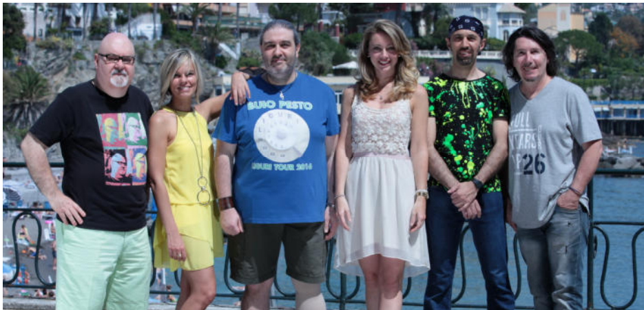
GENOVA – Piazza De Ferrari - 10 Settembre 2011

I Buio Pesto sono la più grande e divertente band dialettale ligure degli ultimi 25 anni. Dal 1995 ad oggi hanno venduto 190.000 dischi (Doppio Disco di Platino), hanno eseguito quasi 1.000 concerti, per un pubblico di oltre 1.400.000 spettatori e raccogliendo 300.000 euro per beneficenza.